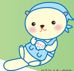
マスクットキャラクター 「かいごん」